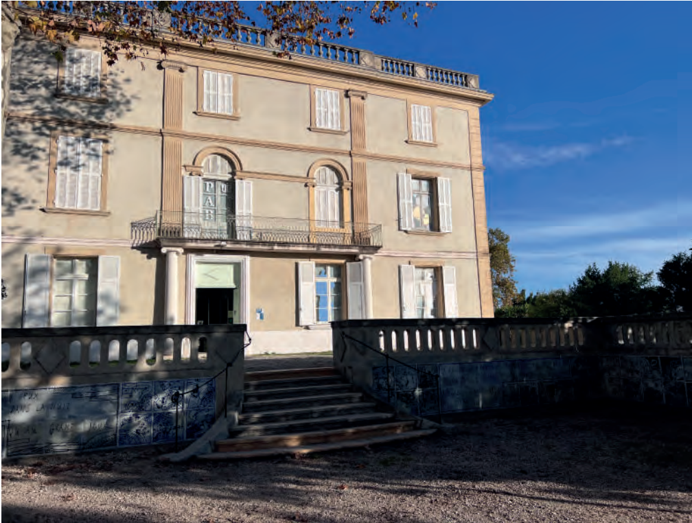
Musée-bibliothèque PAB, entrée

Le PSC du Musée-bibliothèque PAB est un document ambitieux qui témoigne de la volonté de s'adapter aux enjeux du XXI e siècle (notamment en termes de transition écologique) et améliorer son fonctionnement en se fixant des objectifs clairs et des actions concrètes pour renforcer son identité, améliorer son rayonnement et proposer une offre culturelle de qualité pour tous les publics.