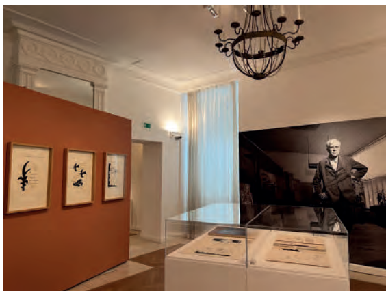
Scénographie exposition Georges Braque, l'œuvre graphique, 2023

Le musée doit devenir un lieu plus accessible et inclusif pour tous les publics et particulièrement les cibles définies par l'équipe à savoir les bibliophiles, le jeune