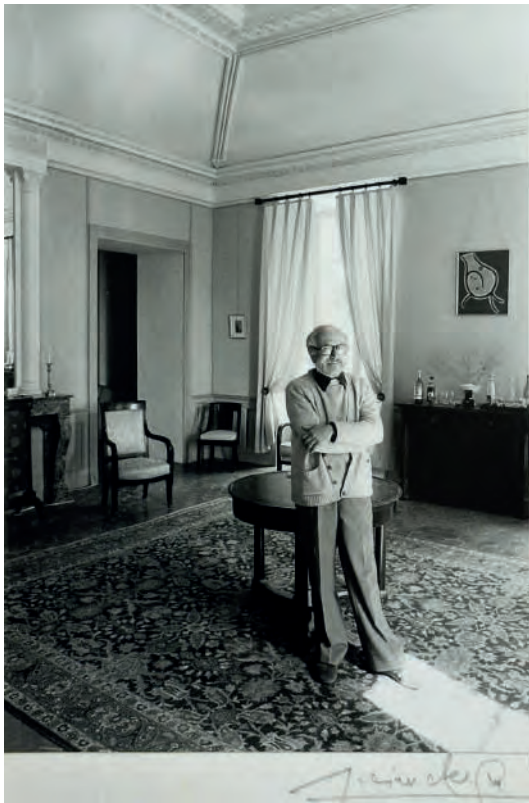
PAB à Rivières-de-Teyrargue